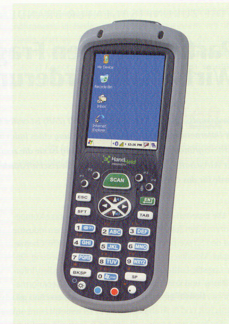
Dolphin 7600 von Hand Held Products

zeit festzustellen, welcher Monteur an welchem Tag zu welcher Zeit an welchem Gerät war, da der Monteur jede Arbeit kommentieren und dokumentieren muss.